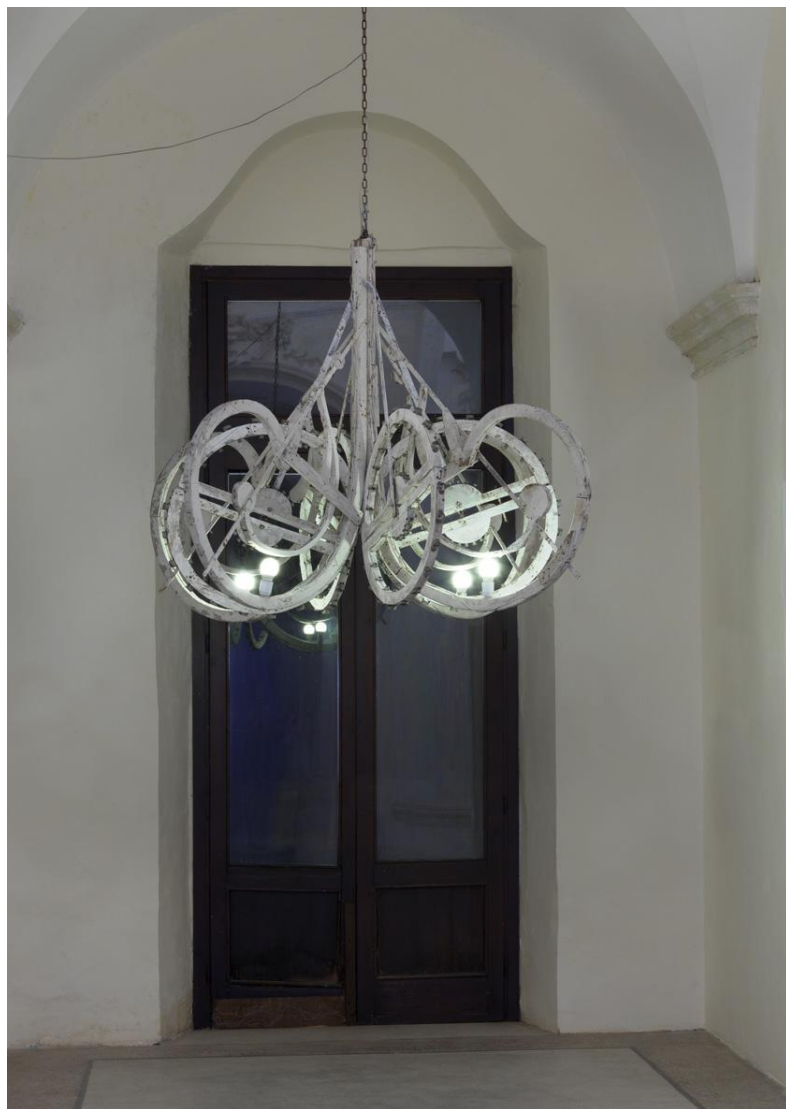
Murano Luminaria Strutture di luminarie, lampadine h 138 147x187 cm