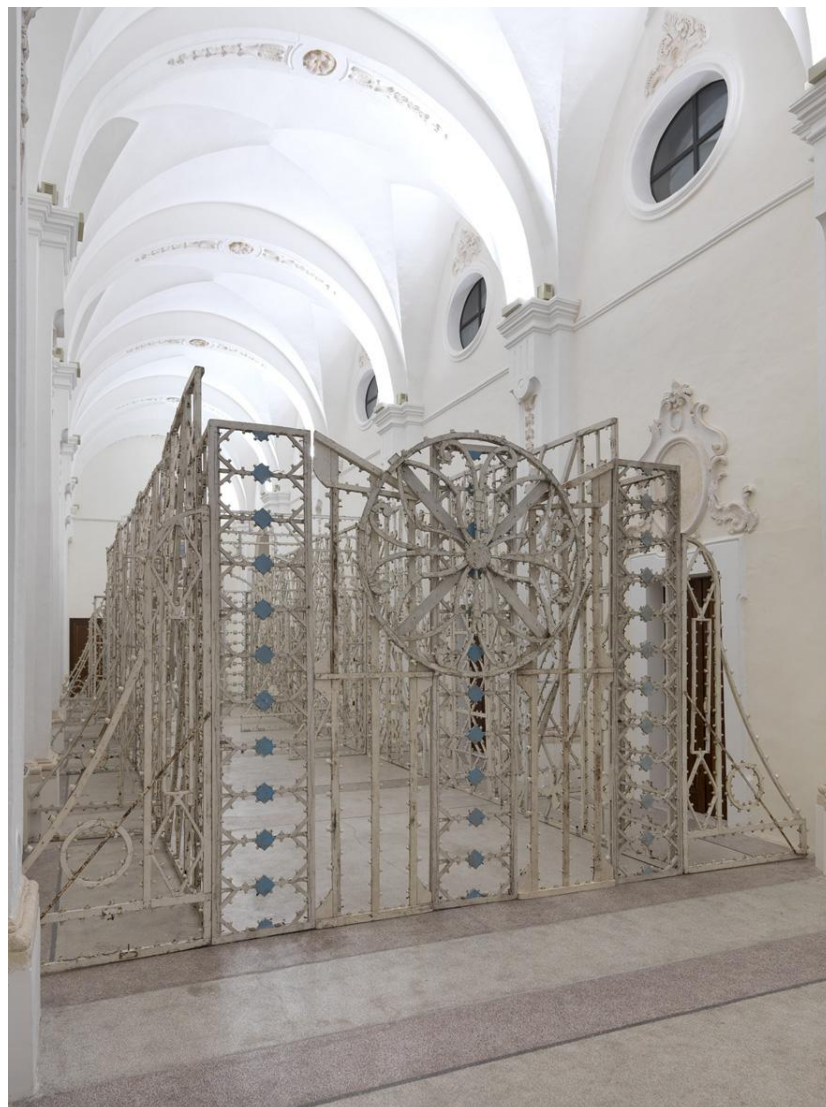
Grande Galleria Strutture di luminarie misure ambiente