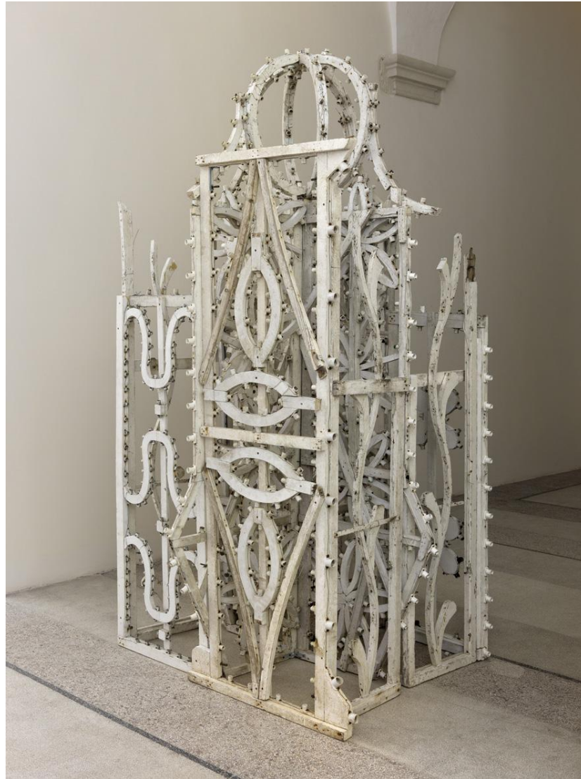
Luminaria Essay Strutture di luminarie h 246 131x138 cm