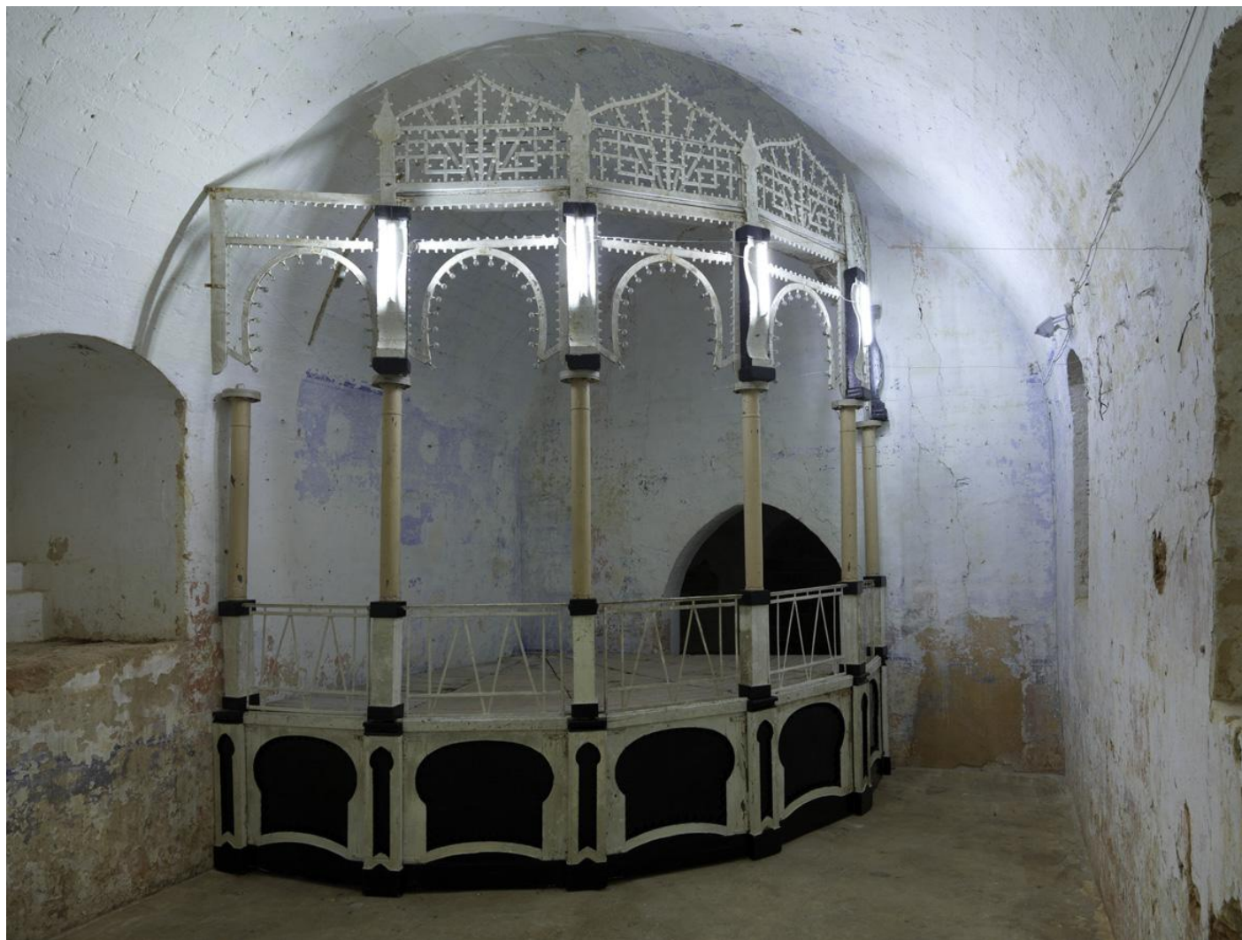
Palco Rettorico Cassa armonica dipinta, neon, misure ambiente